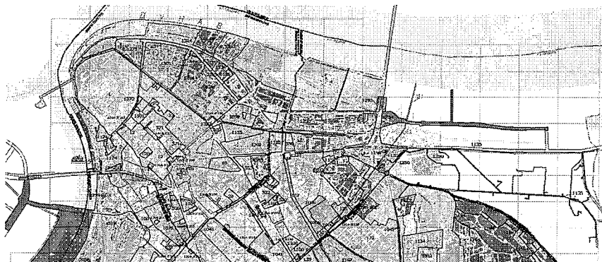
Спровођење плана, План генералне регулације грађевинског подручја седишта јединице локалне самоуправе – Град Београд (Целине I – XIX)

Предметне катастарске парцеле припадају површинама зоне детаљне разраде. Детаљна разрада се у овом случају спроводи непосредном применом правила Плана генералне регулације грађевинског подручја седишта јединице локалне самоуправе – Град Београд (Целине I – XIX) („Службени гласник Града Београда“, бр. 20/16, 97/16, 69/17 и 97/17), у складу са постојећим сепаратима као саставним деловима поменутог планског документа. Деоница 5, односно деоница на чијем се подручју разраде налазе поменуте предметне катастарске парцеле је у овом случају продужетак постојећег дела Интерцептора, дуж Вишњичке улице.